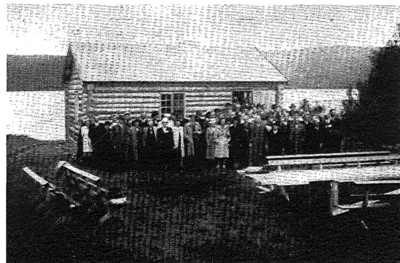
Släktmedlemmar samlade i Huså 1945 framför det egna torpet.